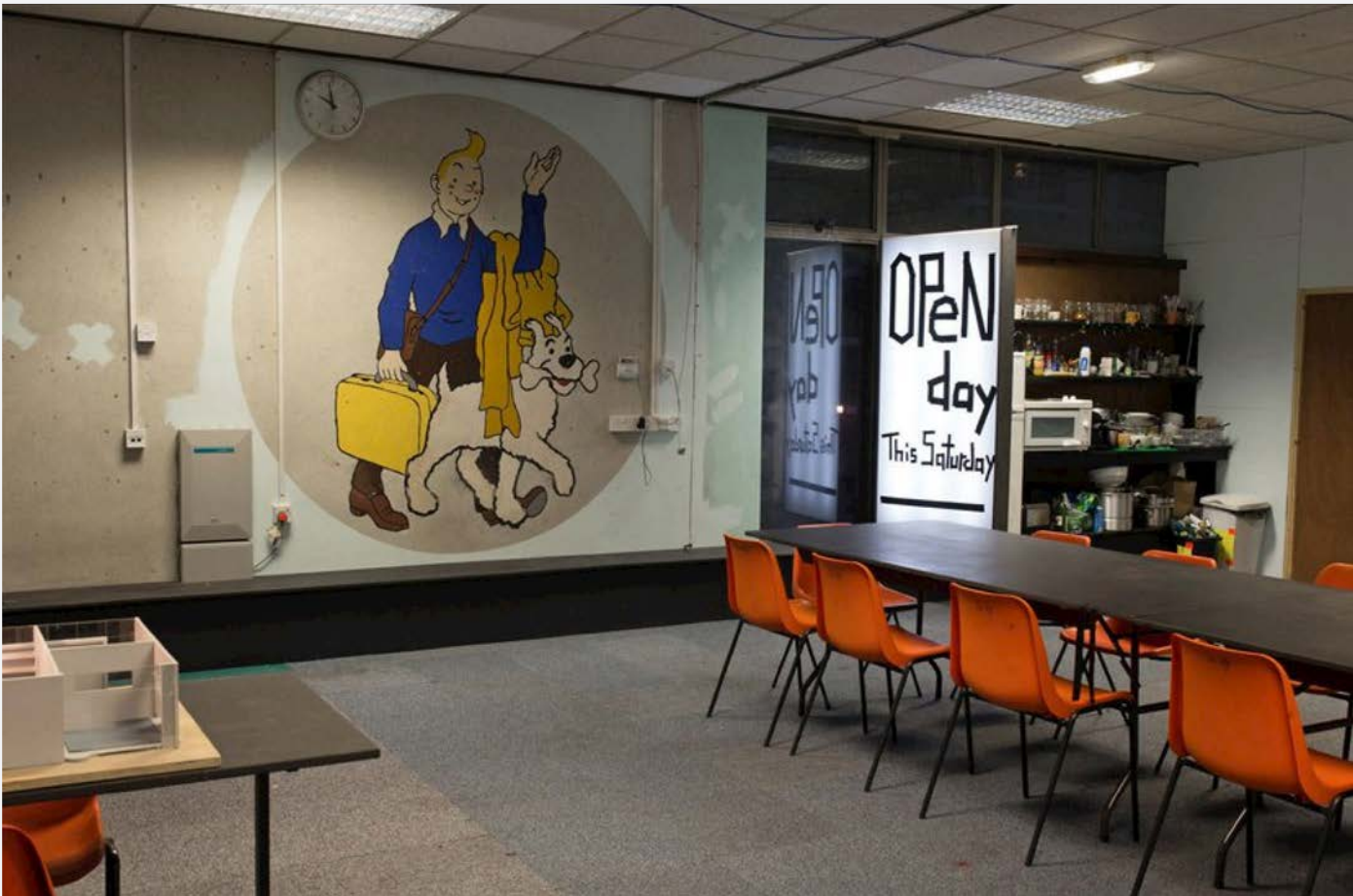
*图为RCA学校研讨会一角