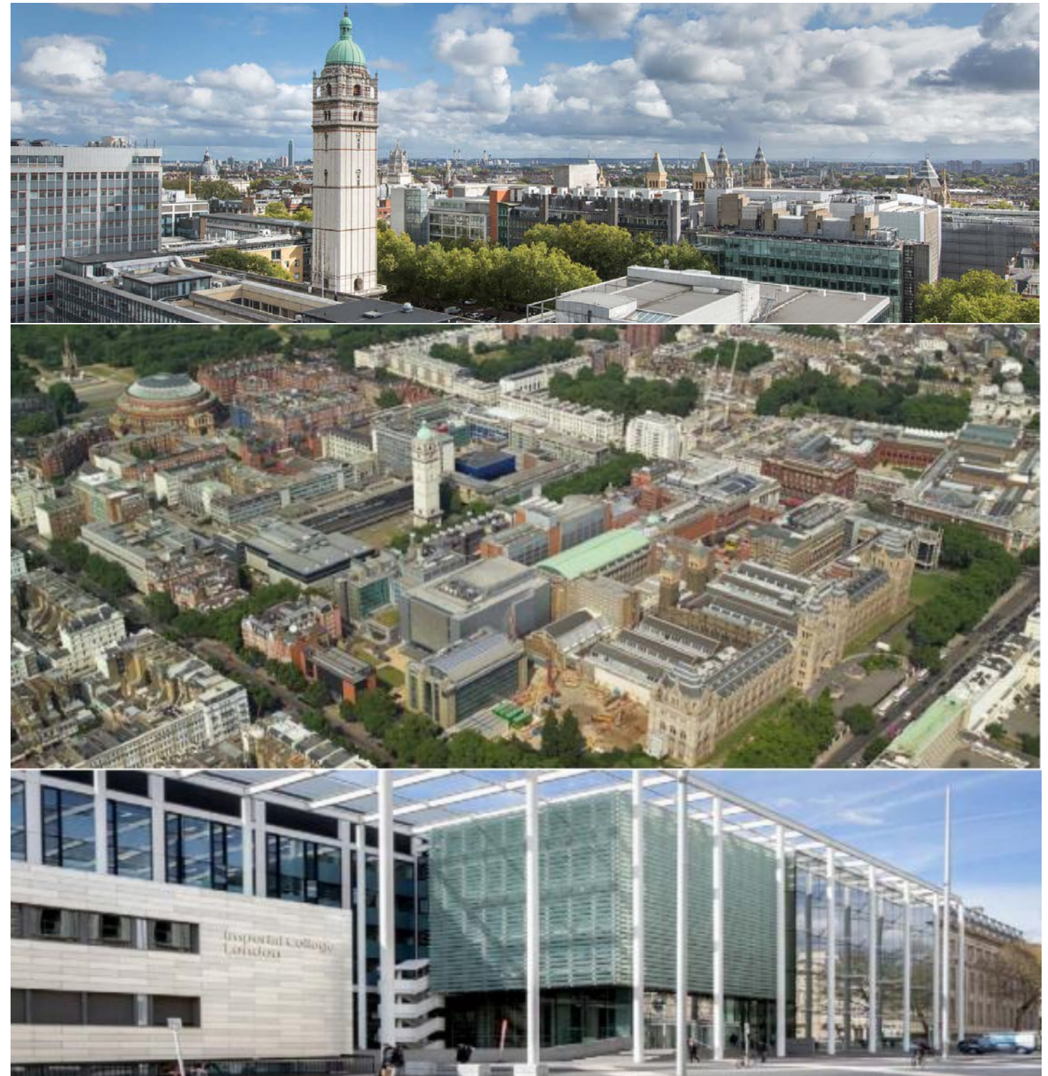
*图为帝国理工学院南肯辛顿校区

成功完成项目的学员，将获得由帝国理工学院和皇家艺术学院各自颁发的证书，及共同颁发的成绩证明。获胜小组的成员将获得帝国理工颁发的Award Letter和其他神秘奖品。