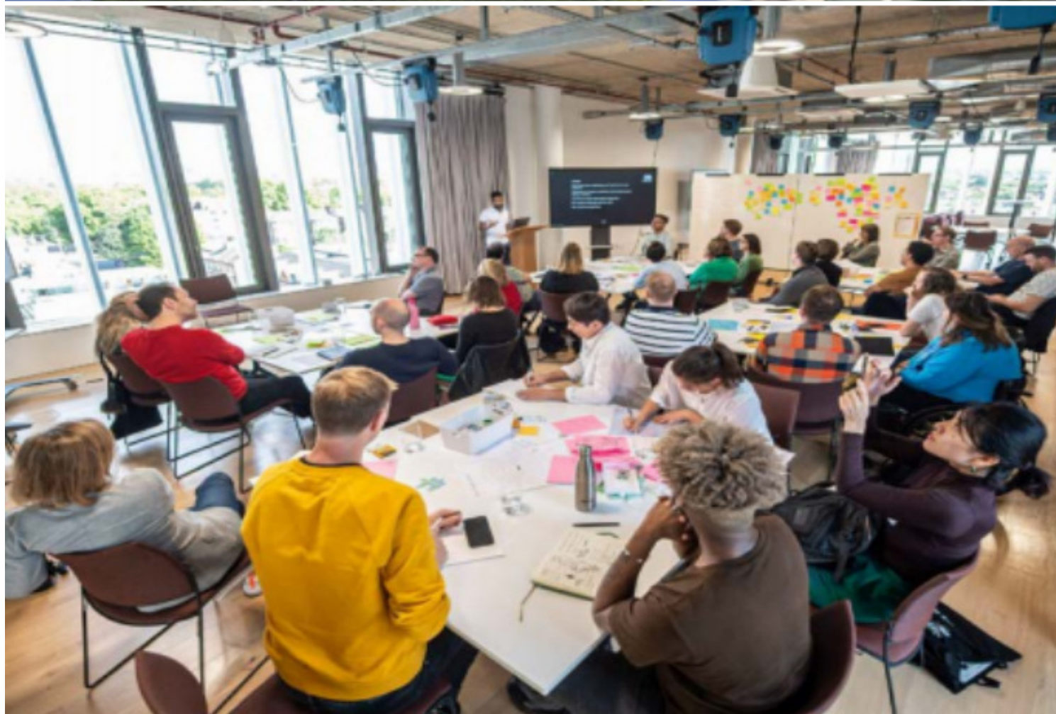
*图为皇家艺术学院新高管教育空间、劳森研发创新大楼

该项目将由帝国理工学院和皇家艺术学院在教育与研究领域的知名学者组成的团队授课。皇家艺术学院的研究生将作为大使支持暑校学校的学生，并参与社交活动，分享他们在英国的学生经历和生活。