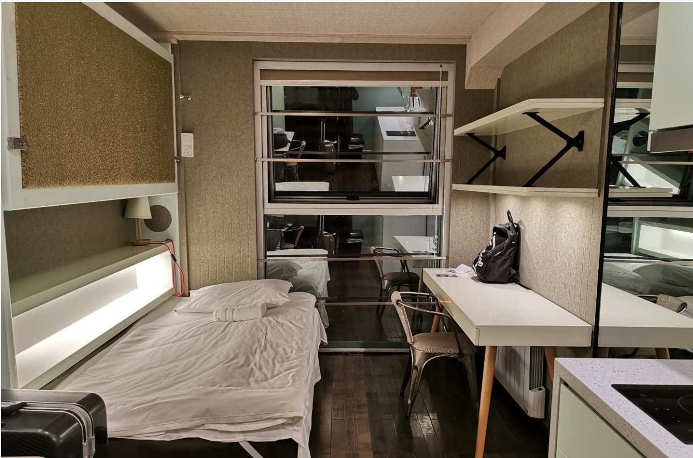
*图为本次summer school住宿房间