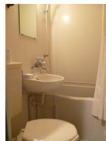
単身室（個室型） / Single studio