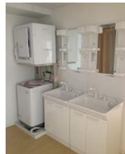
単身室（ルームシェア型） / Single room shared