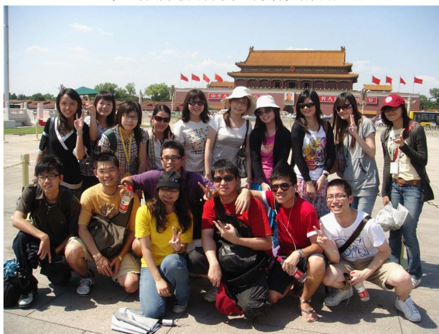
来自海峡两岸的学子们参观天安门广场