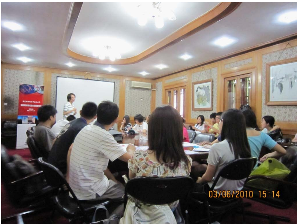
同学们在进行讨论

在为期 18 天的暑期学校中，同学们聆听了老师们对诸多问题的分析，并根据所学得的知识对当下海峡两岸的交流合作和社会热点问题展开了热烈而卓有成效的讨论。