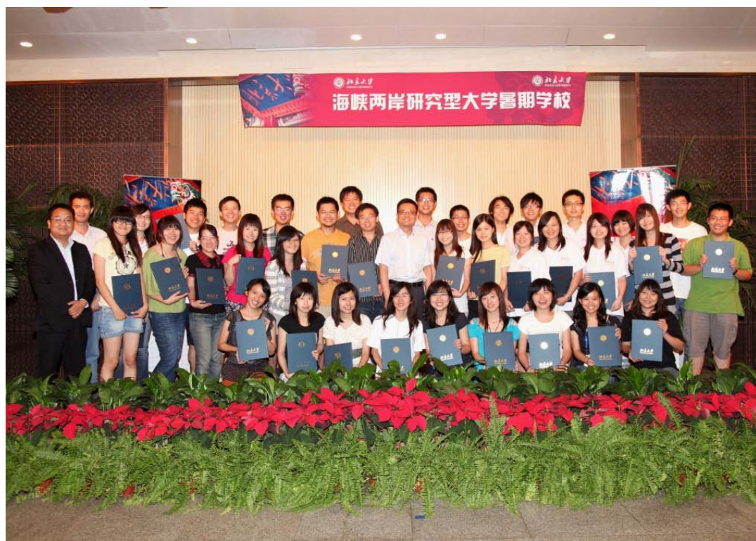
闭幕式上老师与同学们合影

论坛的主题，聚焦于两岸经济合作框架协议（ECFA）下的青年竞争力。ECFA的签订，推进了两岸经济关系正常化进程，明确了两岸经济往来自由化目标，