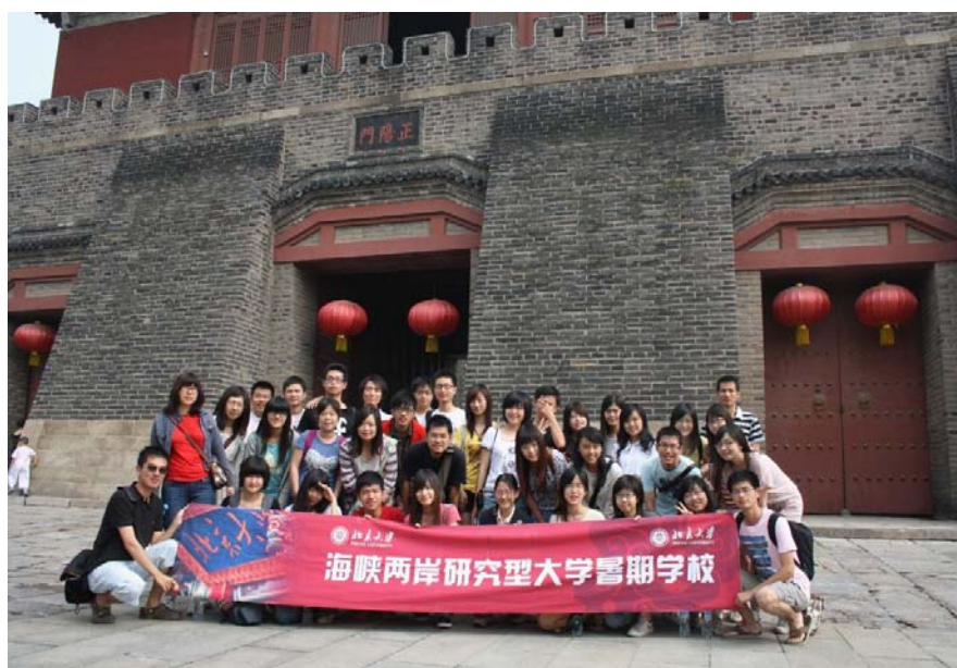
参加暑期学校的同学在山东省参观实践

在暑期学校快结束时，同学们一起来到山东省实践学习。这一深入基层的学习，让同学们对国家的具体情况有了更深刻的了解，同时也加深了同学们对祖国的热爱。