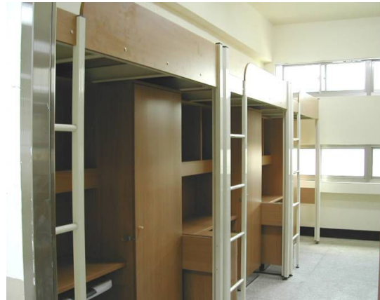
大雅館寢室內部設施