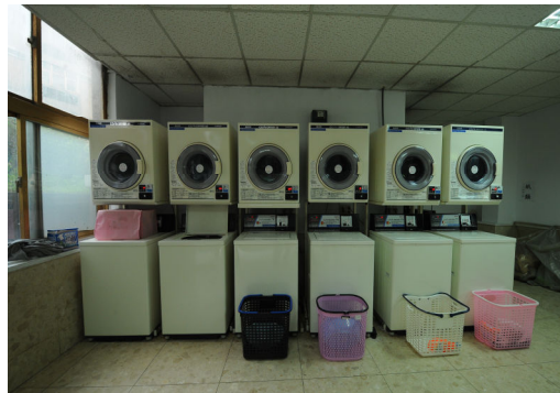
大莊館自助投幣式洗、烘衣機