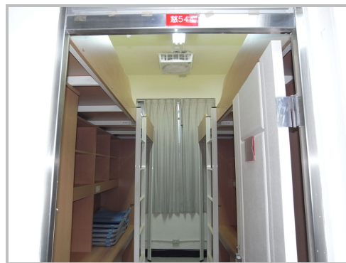
大慈館寢室內部設施