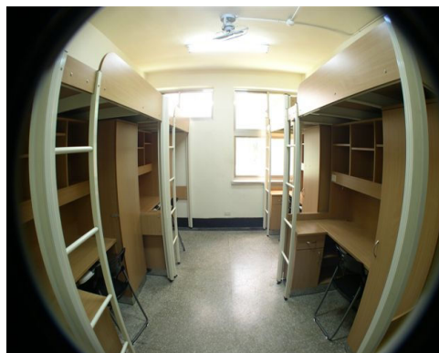
大倫館寢室內部設施